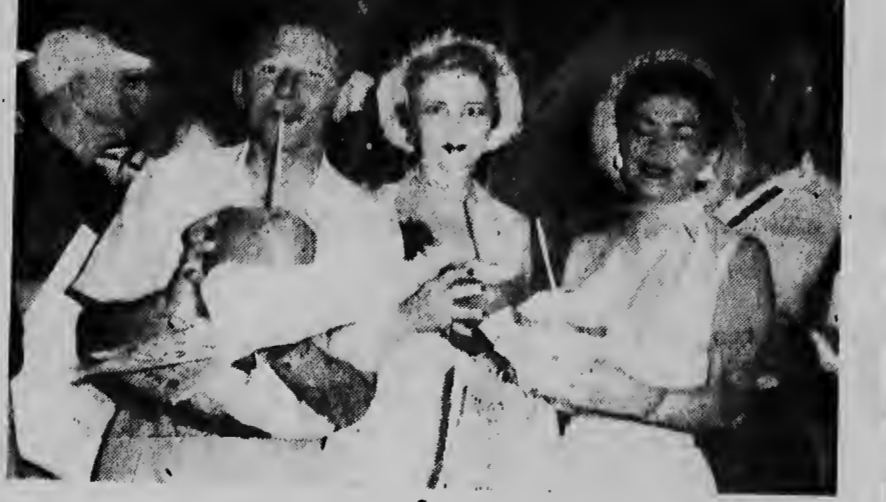
De ARUBA-COCKTAIL smaakt de toeristen van de „Tradewind”